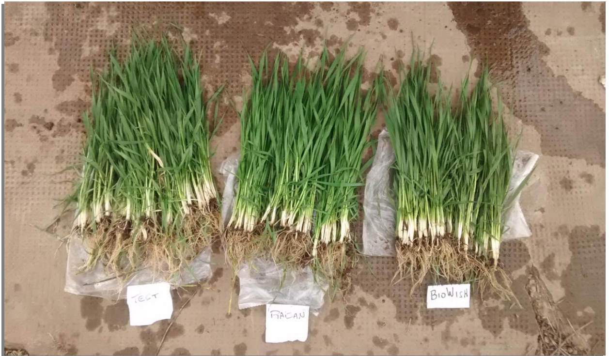
Foto 1: evaluación cualitativa de raíces en el estado de Z3.1 para los tratamientos vinculados a promotores de crecimiento y testigo.

En las dos localidades donde se evaluó un testigo absoluto, la respuesta promedio fue de 150 kg/ha, un 3.5% ( p=0.02 ).